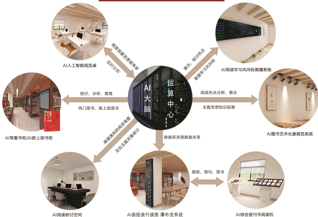
产品功能 流程示意图